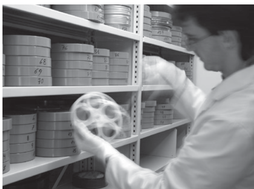
Instal·lacions del Centre de Recerca i Difusió de la Imatge. Ajuntament de Girona, CRDI.

L'aspecte clau de la conservació està en les condicions ambientals, és a dir, en el control de la temperatura i la humitat. Per als suports basats en nitrats, acetats i polièster, hi ha un dipòsit a 12°C i 40% RH. Aquestes condicions, del tot estables, s'aconse-