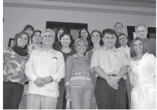
Participants del grup InterPARES 3 a la cimera de Rio de Janeiro. 2009