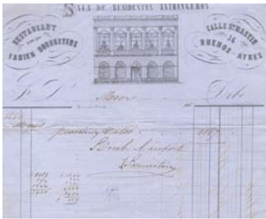
Recibo del Club (1866)

Los investigadores podrán recorrer desde rasgos generales hasta la descripción de cada serie de documentos también en internet .