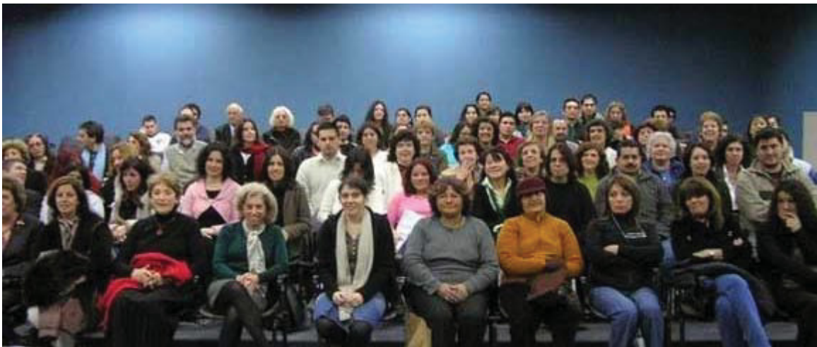
Grupo completo de los asistentes

Buenos Aires. El 9 de agosto pasado se llevó a cabo la segunda Jornada de Bibliotecas y Centros de Documentación de la UBA en las instalaciones de la Facultad de Arquitectura, Diseño y Urbanismo. El encuentro estuvo organizado por el Sistema de Bibliotecas y de Información (SISBI) y asistieron más de cien personas que representaban a bibliotecas centrales de facultades, colegios, institutos, unidades hospitalarias y del SISBI mismo.