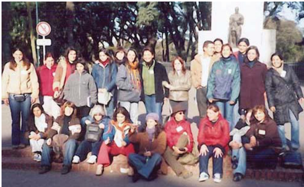
Grupo de visitantes en el Parque Lezama de Buenos Aires minutos antes de ingresar al Museo Histórico Nacional

Córdoba. El 15 y 16 de agosto pasado un grupo de 42 personas —alumnos y docentes— de la Escuela de Bibliotecología de la Universidad Nacional de Córdoba viajaron a Buenos Aires con el fin de conocer algunas bibliotecas y museos de esa ciudad. El viaje fue organizado por las áreas de Procesos Técnicos y de Historia de la carrera y contó con el aval académico de la Facultad de Filosofía y Humanidades (FFyH), institución donde está inserta la escuela, y fue financiado por las fundaciones FFyH y Ferrer Vieyra y por los propios viajeros.