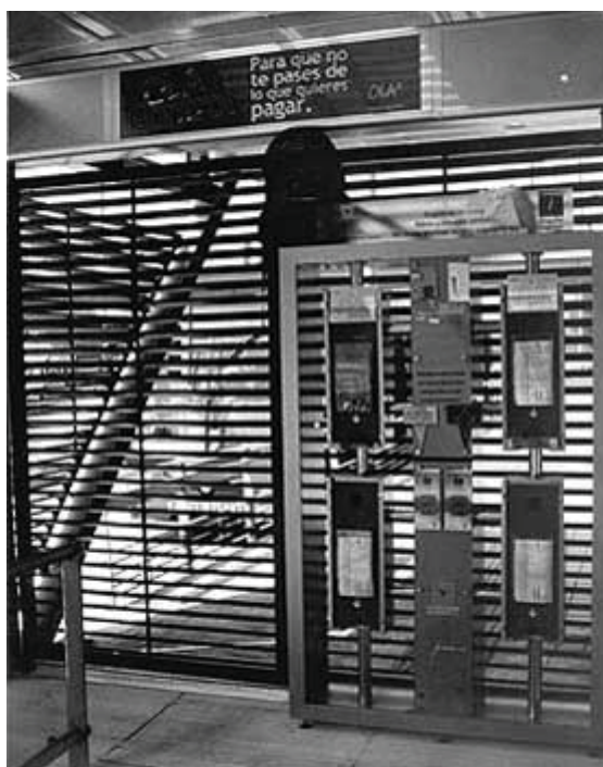
Paraderos Paralibros Paraparques