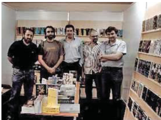
Libreros organizadores de la feria en Rosario

Rosario. Por la Feria del Libro 2005 de esta ciudad pasaron más de 70 mil personas y a la luz del éxito que esto representó para la ciudad sus organizadores ya están trabajando para la próxima edición que se realizará en septiembre de 2006. En primer lugar se está buscando un sitio más amplio, ya que si bien se instaló en todo el