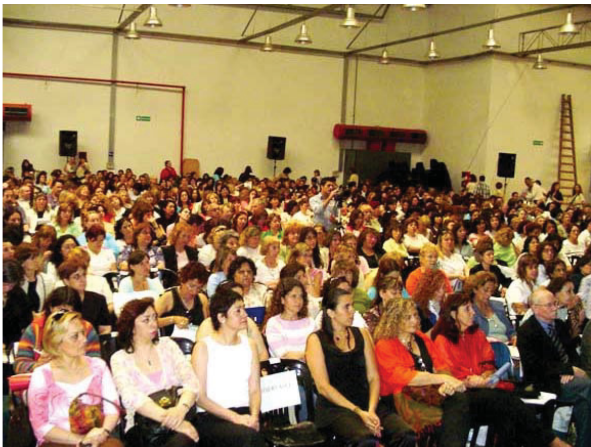
Panorámica de los bibliotecarios presentes en el "Galpón de la Reforma" en el acto inaugural.

Buenos Aires. La VI Jornada Nacional de Bibliotecarios Escolares, que organiza anualmente la Biblioteca Nacional de Maestros (BNM), se llevó a cabo el 18 de noviembre pasado con la presencia de cerca de 1000 personas del ámbito educativo argentino y también del exterior. Contó con el auspicio de UNESCO, la Organización de Estados Iberoamericanos (OEI) y la Organización de Estados Americanos (OEA).