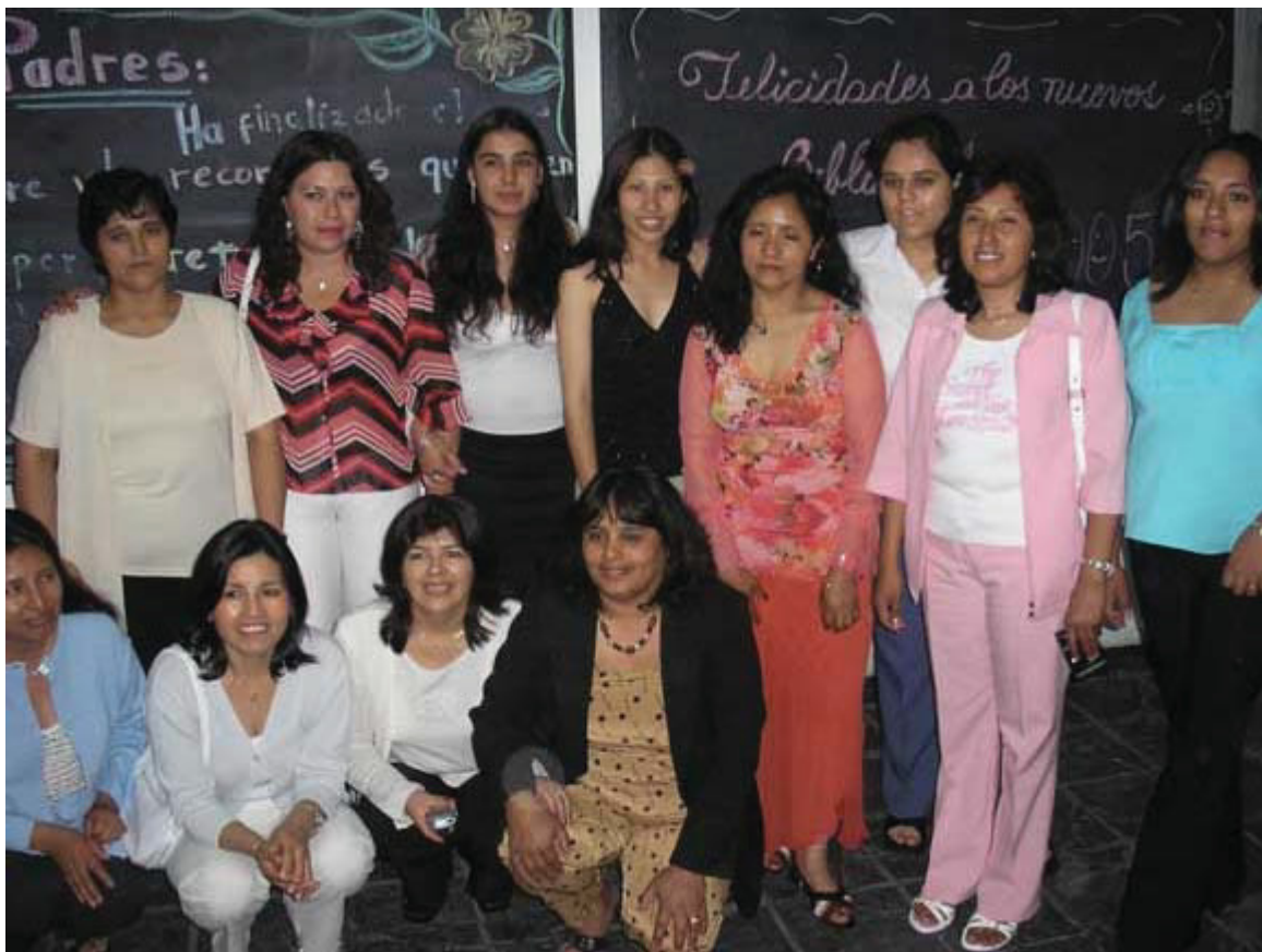
Egresadas 2005 del Instituto Leloir

San Salvador de Jujuy. Con mucho entusiasmo los estudiantes del Instituto Dr. Luis Federico Leloir de esta ciudad celebraron el hecho de pertenecer a la segunda promoción de egresados 2005 de la carrera de Bibliotecología que se dicta en ese instituto. Ya suman 20 los profesionales bibliotecólogos de Jujuy que mediante un gran esfuerzo han logrado alcanzar esta meta debido a