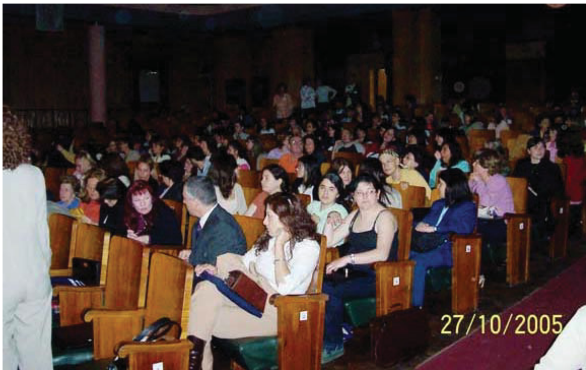
Vista parcial de los asistentes a las jornadas.

Córdoba. El 27 y 28 de octubre de 2005 en el Pabellón Argentina de la Universidad Nacional de Córdoba se realizó la 3ª Jornada sobre la Biblioteca Digital Universitaria con la asistencia de 323 participantes. Fue organizada por la Comisión Organizadora Permanente integrada por Amicus (Red de Bibliotecas de Universidades Privadas) y por las bibliotecas de la Facultad de Ciencias Veterinarias de la Universidad de Buenos Aires, el Sistema de Información y Bibliotecas de la Universidad Nacional de la Patagonia Austral, Santa Cruz, y la Biblioteca Central de la Universidad Nacional de Villa María, Córdoba, con la colaboración de la entidad anfitriona integrada por la Facultad de Ciencias