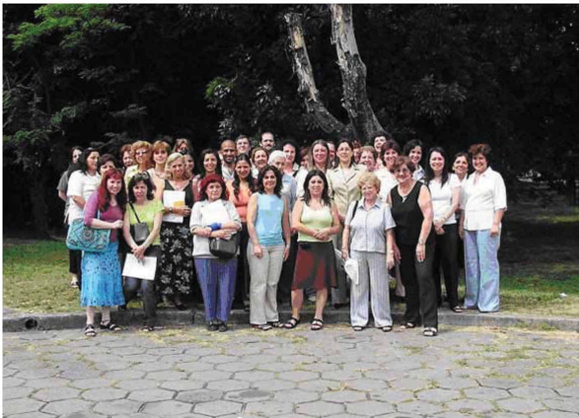
Los asistentes a esta primera reunión

Buenos Aires. Buenos Aires. El 16 de noviembre pasado, en el predio de la Facultad de Ciencias Veterinarias, se llevó a cabo la 1ra. Jornada de Bibliotecas y Centros de Documentación de la UBA, organizada por el Sistema de Bibliotecas y de Información (SISBI) y a la que asistieron 58 personas que representaban a diez bibliotecas de facultades, de un colegio, de cinco institutos, del Hospital de Clínicas y del SISBI mismo.